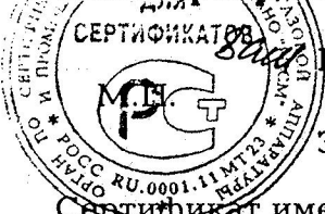
Схема сертификации За.

ДОПОЛНИТЕЛЬНАЯ ИНФОРМАЦИЯ Маркировка знаком соответствия по ГОСТ Р 50460-92 осуществляется на основании сертификата соответствия на изделия и в сопроводительной документации